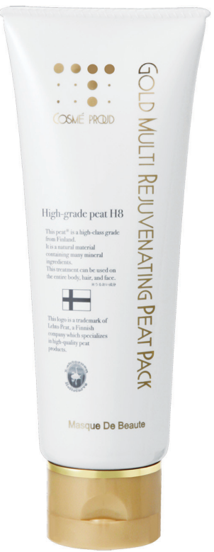
ゴールドマルチリジユブネイティングピートパック120g / 4.2oz (72ドル)

取材日の夜、D子は枝里子さんに連絡を試してみた。すると「あの後に、化粧をしたら肌の化粧のりが全く違い驚きました。今日はクリームだけでファンデーションいらすませんでした。素敵な経験をありがとうございます」と何とも嬉しい返事をくれた。 後日、D子もパックを試してみた。乾燥が気になり始めていた今日この頃、このパックはすごくいい〜肌肌ハリが出て、艶やかな肌になったような気がするわ。早速コスメプラウドに電話して、注文をするわ。