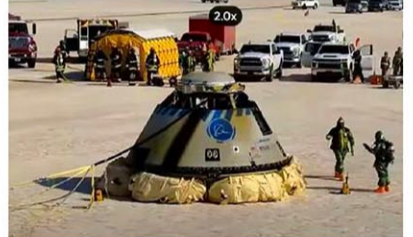
25日、米ニューメキシコ州に着陸したボーイングの新宇宙船スターライナー

米航空宇宙大手ボーイングが開発中の新宇宙船スターライナーが25日、地上と国際宇宙ステーション（ISS）を往復する無人の飛行