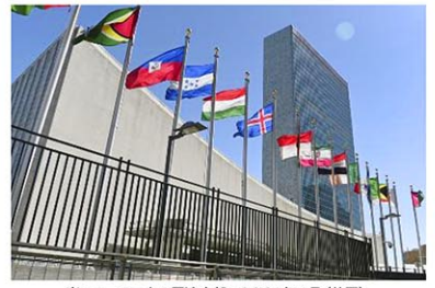
米ニューヨークの国連本部=2021年4月

中国とロシアは、制裁強化は北朝鮮国民の困窮を深めるだけだとして、逆に制裁緩和が必要としている。