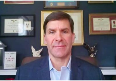
オンラインでインタビューに答えるエスパー前米国防長官=25日

エスパー前米国防長官は25日、共同通信とのオンラインでの単独インタビューで「台湾は主権国家だ」と明言し、中台が不可分の領土だとする中国側の原則を踏まえた「一つの中国」政策を「再検討する時期に