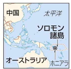
ソロモン諸島、中国、オーストラリア(共同)

【シドニー共同】中国の王毅國務委員兼外相が26日、南太平洋の島国ソロモン諸島を訪問した。オーストラリアのメディアが報じた。王氏はソロモンと4月に締結した安全保障協定についてソガバレ首相らと協議するとみられる。協定の内容は明らかになっていないが、中国艦艇の寄港や軍隊、警察の派遣を認めるものとみられている。