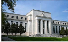
米連邦準備制度理事会 (FRB) 本部

【ワシントン共同】米連邦準備制度理事会 (FRB) は25日、今月3、4両日に開いた前回の連邦公開市場委員会 (FOMC) の議事録を公表した。「出席者の大半が今後2回の会合で0・5%利上げすることが適切な可能性が高いと判断した」とし、6月と7月の会合でも0・5%の大幅利上げをすることへの幅広い支持を示した。