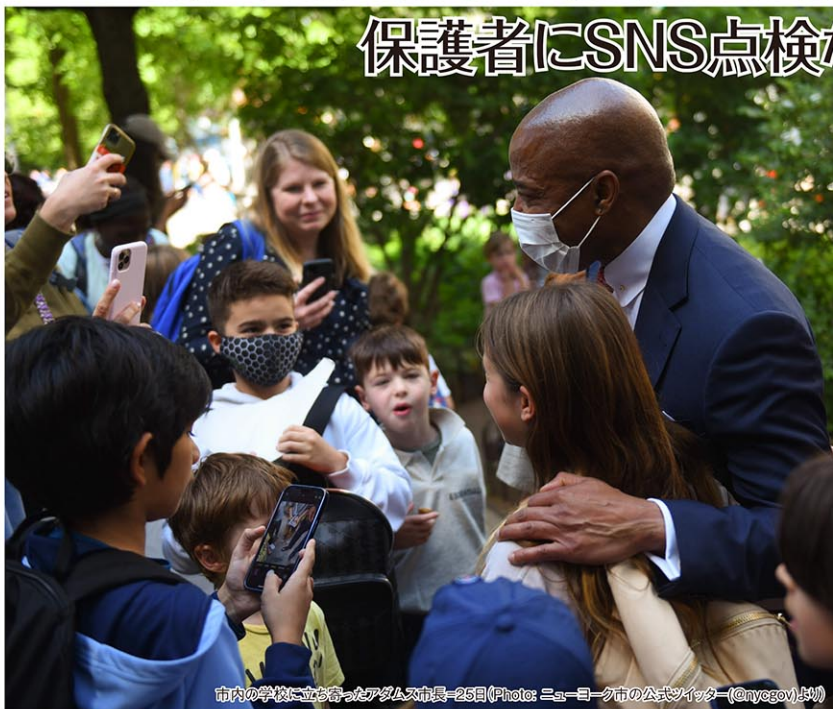
市内の学校に立ち寄ったアダムズ市長=25日

24日にテキサス州の小学校で21人が犠牲となった銃乱射事件の発生を受け、ニューヨーク市のアダムズ市長は25日、バンクス教育局長とともに記者会見を行い、学校の安全対策を強化する方針を表明した。同日、amニューヨークが報じた。