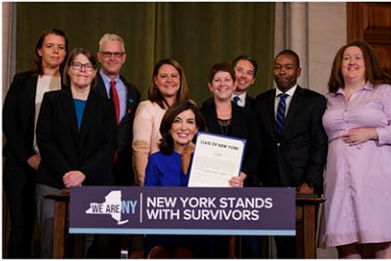
ホークル知事の公式ツイッター (@GovKathyHochul) より =24日

ニューヨーク州のホークル知事は24日、成人への性的虐待に対する民事上の時効について、11月から1年間にわたり一時的に停止する法案に署名した。全米で、