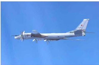
日本周辺を飛行したロシアのTU95爆撃機=24日

ザハロワ氏は、中ロの合同パトロールは国際法を順守して定期的に行われ、アジア太平洋地域の平和と安定に