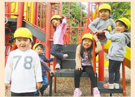
季節と自然の遊びも充実

「かけがえのない幼児期を日本語で」をモットーに、日本語による長時間保育を行っています。四季折々の日本の文化や伝統行事をふんだんに取り入れ、みんなで楽しめます。紙芝居や日本の歌、わらべ歌、手遊び歌などを園生活に組み入れ、日本語による保育を充実させています。また、野菜の種を蒔いて、水をあげたり、観察したり、最後には収穫もして昼食と共に頂いたり、植物の成長も一緒に体感したりもします。