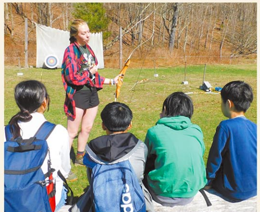
中等部イーストバレー宿習学習／新年度早々の宿習学習では、大自然の中で現地スタッフ指導による野外体験などを通じ、自主性や協働性を高め、より良い人間関係を築きます。