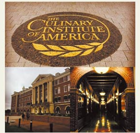
フレンチやイタリアンなど複数のレストランが利用できる

Address 1946 Campus Dr Hyde Park, NY 12538 Website https://www.ciachef.edu/