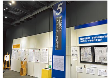
横浜ニュースパークの「多様性」企画展

紹介するのは、日本の近代において、女性、民族、障害、疾病を理由にした不当な差別についての記事が主ではない。今日のLGBTQ、犯罪被害者、外国人労働者、在日コリアン、中国残留邦人などを含む日本社会の多様性をメディアがきちんと伝えていることも展示でわかる。「男性らしさ」が求められるプレッシャーでさえ伝えている。