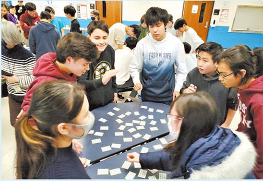
日本の学校文化や伝統文化、行事等に触れる機会も大切にしている。W校の百人一首大会(上)と球技大会(下)