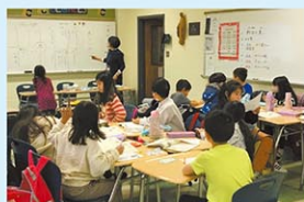
教員がチームになってお互いに問題の答 えを確認し合うなど、お互いに学びあい、 高めあうグループ学習を行っています。

補習校に通っていたというのは僕の 未来にとって大きな財産になると思 います。国語、数学、社会はもちろん、補習 校生活で出会った新たな友達や先生た ちとのやりとりも僕にとって大事な経 験になると思っています。今後、日本に 行くと、補習校で蓄えた数々の知識や 経験を活かせたいし、などと考えています。