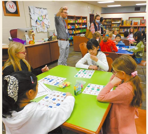
初等部現地校との学校間交流／互いの学校を行き来し、それぞれの国の文化を交えた活動の中で、英語で気持ちを伝え合える喜びや楽しさを体験します。

今はオンラインでどこにいても学べるので、Zoomを活用し、日本で行われる研修会や私的な学習会（大学教授にご指導いただいているゼミ）に継続的に参加しています。日本にいる教員との交流によって教育現場の「今」を知ることができますし、小学校から大学まで様々な校種の教員の目で、自分の指導案や録画した授業を見てもらうことで、大きな学びを得ています。