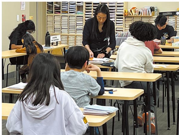
公文リッジフィールドパーク教室での授業の様子

お役に立てると思います。私自身の子供も今年から日本の高校に通うようになりますし、日本の受験環境は、公文としても認識しています。公文の「得意なところを伸ばす」という教育は、帰国生入試などで活かせると思います。また公文では、数学を中心に1年間で学校カリキュラムの2年分を習熟することを目標としています。例えば、小学4年生で入会されますと、当初1年はこれまでの学習の正しい理解とキャッチアップに重みを置きますが、5年生には5年生と6年生、6年生には中学1年生と2年生の範囲が習熟することを目指します。駐在のお子さんの割合は高くはないですが、日本語を話せる指導者もいますので、まずはお問合せいただければと思います。