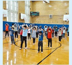
幼児から高等2年生までの一貫教育を提供。L校/餅つき大会と剣道体験(上)、高等部、幼児部の交流(下)