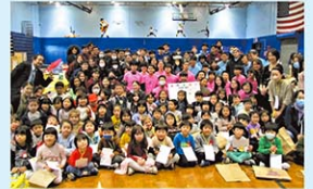
W校 / 中等部、幼児部交流のみの市での集合写真