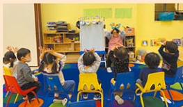
たくさんの日本語学習プログラムを備えています。

ニューヨーク育英学園のマンハッタンプランチとして1997年に開校。日系、長期・短期滞在、国際結婚などの様々な背景を持った子どもたちに、日本の伝統や文化に触れる機会を提供し、日本語による子どもたちの人格形成の基礎づくりを目指しています。アップパーウエストの閑静な住宅地の中に広く落ち着いた雰囲気のある教室や保育室を有しています。