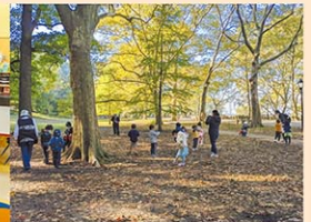
近くにはハドソン川を望む公園

土曜日と日曜日にウィークエンドスクールを開催しております。レベルや年齢に合ったクラスで、日本語を学ぶ、または日本語で国語と数学を学ぶことができます。