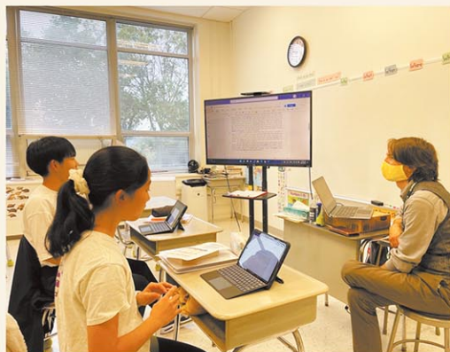
英語の授業風景。1年生からネイティブの英語教員による週4～5時間の授業を受けるので、英語力は格段に伸びます。また、現地の英語教材を併用しているので、生きた英語力が確実に向上します。

中等部卒業生は100%の進学率です。現地のハイスクールへ進学する場合がありますが、ほとんどの進学先は日本の有名進学校になります。将来、本校在籍者一人一人が国際社会で活躍することを願っております。