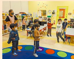
レベルに応じた少人数制クラス