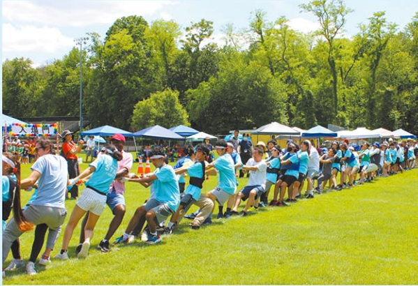
年間を通して各種行事を実施しています。充実した学校行事から、日本の習慣・伝統に触れて、楽しく日本語と日本文化を学べる学校を目指しています。