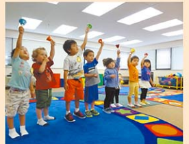
わらべうた、手遊びなどの日本語保育

基本的な生活習慣や言語力を培おうとしている、2歳から4歳の一番大切な時期を、子どもたちの年齢や個性に合わせて、細やかに対応できるアットホームな環境と保育士が自慢です。日本語のシャワーをたくさん浴びて、すくすくと成長していくこども園の園児たちは、毎日元氣な笑顔を見せてくれています。