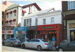
Olde Village Inne

ナイアックはハドソン川にかかるクオモ橋（旧タッパンジー橋）の西側のたもと、ニューヨーク州ロックランド郡にある小さな町です。かつては水上交通の要所として、船で移動する人々の往來でにぎわいました。メインストリートには古い街並みの面影が残っており、美しいハドソン川を眺めながら観光することができます。歴史を知るとより情緒を感じられます。もともとナイアック・インディアンと呼ばれる人々が住んでいたナイアックの町は1782年に設立され、マンハッタンに住む富裕層の避暑のための別荘地として栄えました。チャールズ・チャップリンが3番目（もしくは4番目）の妻ウーナ・オニールとともにカリフォルニアを出て、この町の古い軒家を借りて5週間滞在したことも有名な話です。メインストリートはアメリカのローカルな雰囲気を感じられ、雑貨店やピザ店などいろいろな店が並びます。クラフトビールを提供する店もいくつかあり、Olde Village InneとPROHIBITION RIVERの2店舗は特別におすすめ。のんびりと町を散策しながら半日過ごすことができます。道路わきまで店の机が並んで、ビールを飲みながら、週末の音楽イベントも聞きながら過ごしていただくと、これはまさにローカルのアメリカ！を感じることができる素敵な町です。