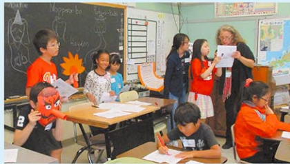
日本人とアメリカ人のスタッフが一緒にバイリンガル教育を推進しています。

ニューヨーク育英学園のメインキャンパスであるニュージャージーキャンパスは、ニュージャージー州フォートリーの北隣のエッジウッドクリフにあり、マンハッタンから車で10分程度の緑豊かな治安のとてよよいところにあります。運動場や中庭には芝生が敷き詰められ、りすや野兎が行き来しています。校内には学年ごとに学級園や小さいながらも田んぼもあり、理科の植物観察をはじめ、秋には収穫したものを調理し、おいしく頂く活動もあります。