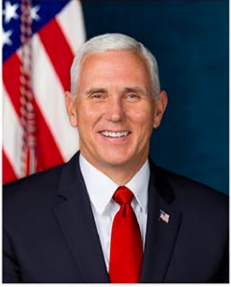
ペンス前米副大統領

【ワシントン共同】ペンス前米副大統領(64)は28日、西部ネバダ州で演説し、2024年大統領選の共和党候補指名争いからの撤退を表明した。かつて仕えたトランプ前