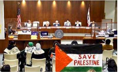
24日、米リッチモンド市で開かれた公聴会。傍聴者が掲げる「パレスチナの旗を掲げ、パレスチナを救え」と書かれている

【ロサンゼルス共同】米政府がイスラエルに肩入れする中、西部カリフォルニア州リッチモンド市が、イスラエルによるパレスチナ自治区ガザへの攻撃を