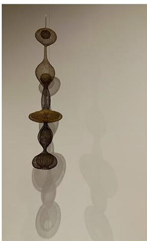
ホイットニー美術館での個展から。 [無題](Hanging Six-Lobed, Complex Interlocking Continuous Form within a Form with Two Interior Spheres)1955 (refabricated 1957-58)

ブラック・マウンテンでは、専門分野の垣根を越えた学際的講座で、マース・カニングハム（ダンサー）、ジョン・ケージ（作曲家、音楽理論家）、ジェイコブ・ローレンス（黒人画家）、