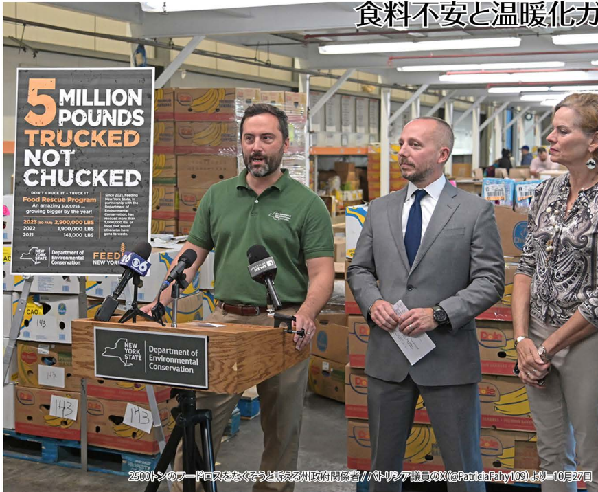
2500トンのフードロスをなくそうと決める州政府関係者=10月27日

ニューヨーク州のホークル知事は27日、州の「食品ロス」削減プログラム「フィーディング・ニューヨーク・ステート」を通じて回収した食品が500万ポンド、約2500トンの大台に乗ったと発表した。