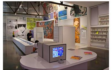
ソニーグループが米ニューヨークで始めた漫画の展示会=27日

に建設中のビル「銀座ソニーパーク」の施設に生かすことなどが狙い。銀座の「ソニーパークミニ」にも、ニューヨークでの展示会の雰囲気味わえる空間を今月28日～11月6日に設置。