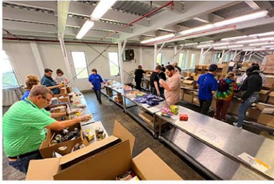
食べられるのに捨てられる食品が2500トンもあり、全てゴミになるのは問題だ。/ NYSDEC コミッショナー・バジルのX (a/BasilSeggos) より10月27日

回収した食品はフードバンクを通じて無料配布。困窮世帯の食料不安削減に役立てる。さらに、食品廃棄物が減る分、ゴミ埋立地からの地球温暖化ガスの発生を食い止める効果もある。500万ポンドの食品ロス削減は「コミュニティに健康的な食料を供給し、環境保護目標の達成に寄与する」とホークル氏はコメント。このプログラムの責任