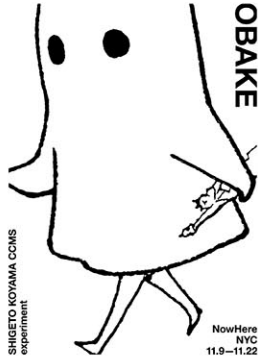
NowHere NYC 11.9-11.22