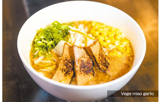
Vege miso garlic