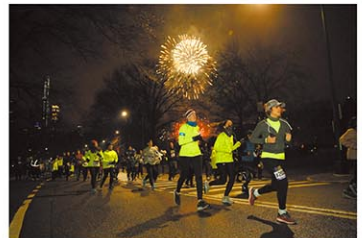
イベント公式FBより

新しい年を迎える瞬間をマラソンで迎えるという、アメリカらしい年越しイベント。スタート地点のセントラルパークでは、新年を祝う打ち上げ花火をベストなポジションで見ることが出来る。マラソンで健康的な一年の始まりを迎えよう。