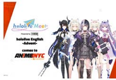
イベント公式FBより

アメリカ最大規模のアニメイベントがNYで開催。全米から多くのアニメファンが足を運ぶ人気イベントのため、事前に入場/パスをオンラインで購入する必要があります。日本でもお馴染みの漫画やアニメグッズだけでなく、プレミア上映やトークイベントなども開催される。