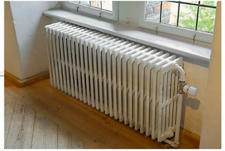
ラジエータータイプの暖房

一方で、ご自身で空調機器に手を加えることができない集合住宅にお住まいの場合、冬場の乾燥時には、加湿器機能付き空気洗浄機を使用されることをお勧めします。ダイキンも、アメリカで空気清浄機を展開してお