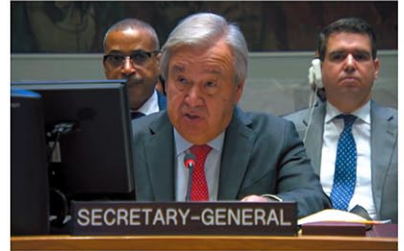
グテーレス事務総長は「人間の尊厳を覚え、偏見を捨ててほしい」と国連安保理で訴えた

ニューヨークーは、「反ハマス」「反イスラエル」双方が立ち上がり、連日のデモで対立し逮捕者