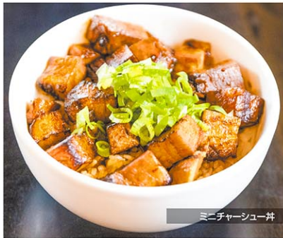
ミニチャーシュー丼

そのほか、アメリカで需要の高いヴィーガンラーメンについては、開店当初は1種類のみだったところ、現在は3種類の展開がある。みそスープはアジア系のお客様だけでなく、多くの方に人気があるため「Vege miso garlic」も好評をいただいている。野菜のみで仕上げたスープと、卵なしの麺、タンパク質もしっかり取るよう、チャーシューには厚揚げを使用し、100% ヴィーガンを実現。スープにガーリックを効かせることで、味に深みとコクが生まれ、満足感のある一杯に仕上げている。日本人には、あっさりとした「Yuzu shio」も人気。こちらはシンプルなラーメンに柚子の香りがアクセントとなった一杯で、NY ではあまり見かけない組み合わせである。雑味のないスープの味わいを邪魔せぬよう、細麺を使用し上品に仕上げている。