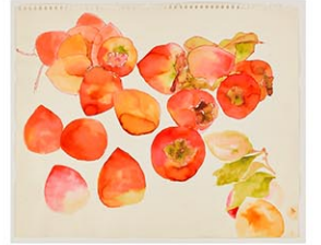
Ruth Asawa, Untitled (WC.252, Persimmons), c. 1970s-80s. Watercolor on paper, 14 x 17 in (35.6 x 43.2 cm). Private collection. Artwork © 2023 Ruth Asawa Lanier, Inc./ Artists Rights Society (ARS), New York.