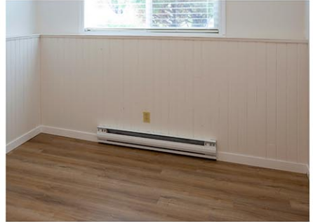
ベースボードタイプの暖房

りますので是非ご検討ください(笑)。室内空気中の有害物質対策としては、フィルター付の標準の空気清浄機を選ばれるのがいいでしょう。ダイキンの空気清浄機は高効率なHEPAフィルターが内蔵されており(笑)。ご自宅に、壁掛けエアコンなど、フィルターが備え付けられている室内機があれば、ぜひ定期的な掃除や交換などのお手入れを欠かさずに！(続く)