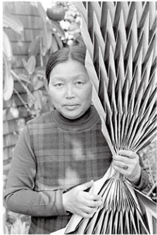
Laurence Cuneo, Ruth Asawa holding a paperdoll, c. 1970s. Gelatin silver print, 9 13/16 x 7 5/16 in. (24.9 x 18.6 cm). Courtesy of the Department of Special Collections, Stanford University Libraries. Photograph © Laurence Cuneo. Artwork © 2023 Ruth Asawa Lanier, Inc./ Artist Rights Society (ARS), New York. Courtesy David Zwirner

され、アサワと母親と5人の兄弟はサンタ・アニタ戦馬場強制収容される。その後アーカンソー州日系人強制収容所に送られる。収容所ではディズニー・スタジオのアニメーターや美術講師など日系人アーティストと知り合い絵を描くようになる。収監中にアートに目覚め、その後は1946年にノースカロライナ州のブラック・マウンテン・カレッジに進み芸術を学ぶ。ジョン・ケージやマース・カンニングハム、ドイツのパウハウスに学んだヨゼフ・アルバース、バックミンスター・フラーなど名だたる前衛芸術家や思想家が教授陣で、実験的な芸術を基礎としたリベラルアーツ教育をする進歩的な大学だった。