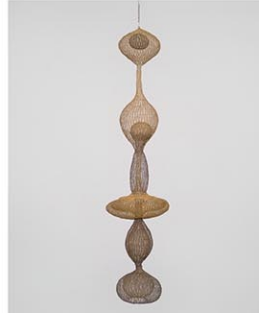
Ruth Asawa, Untitled (S.270, Hanging Six-Lobed, Complex Interlocking Continuous Form within a Form with Two Interior Spheres), 1955 (refabricated 1957-58). Brass and steel wire, 63 7/8 x 14 15/16 x 14 15/16 in. (162.2 x 37.9 x 37.9 cm). Whitney Museum of American Art; gift of Howard Lipman 63.38. Artwork © 2023 Ruth Asawa Lanier, Inc./ Artists Rights Society (ARS), New York.