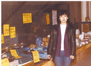
セール会場での写真、顔と拳に力が入る。

「最初の1年はレストランで働きながら、休み時間と休みの日に行商していたのですが、レストランのシェフからは扱ってもらえず、アパートの部屋に在庫がいっぱい溜まってしまいました。自分の好きなもの、良いと思ったものを仕入れてみたのですが、当時は業務用と家庭用の食器の違いというの知らなくて、全部家庭用だったのです」 「困ってどうしようなんて思っていたら、フォートリーのオークツリーセンターのアカネサロンのお隣に空きスペースを見つけて、大家さんに頼んで土日にタダで場所を貸してもらいました。ファイナルセールにして、レストランに売れないものが2日間で5000ドル売れました」