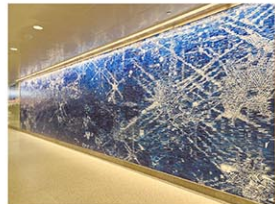
River Light (2022) by Kiki Smith

ための契機として一掃された。犯罪の巣窟ともいわれた地下鉄がきれいになり犯罪は激減したが、一方で特有の地下鉄アートを惜しむニューヨーカーも少なくなかった。