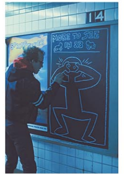
Subway Drawing (1983) by Keith Haring Photo by Makoto Murata 1983

セントラル駅にはアートが溢れかえっている。タイムズスクエア/42丁目駅のロイヤリティンスタイン『タイムズ・スクエア・ミュージアル』(1994年)、グランドセントラルと結ぶシャトルの通路にあるニック・ケイブのモザイクとビデオによる『イーチワン、エブリワン、イコール・オール(みんな平等)』は注目株だ。グランドセントラル駅には、中央コンコースの天井画はもとより、グランドセントラルマディソン駅コンコースに草間彌生の大壁画『愛のメッセージ、私の心から宇宙へ』(2022年)、キキ・スミスの『リパー・ライト』も時間を忘れさせる大作だ。駅構内はもはやアンダーグラウンド・ミュージアムだ。80年代に地下鉄で始まった大眾のためのアートは生き続けている。