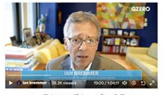
ユーラシア・グループのG Zero Mediaでトップ10リスクについて話すイアン・ブレマー氏

世界トップ10のリスクを毎年発表する国際政治学者イアン・ブレマー氏は、2024年米大統領選挙について「トランプ氏が勝つと思う。彼が現在候補者であること自体が、アメリカの民主主義がうまく機能していないという危機の表れだ」と警鐘を鳴らした。