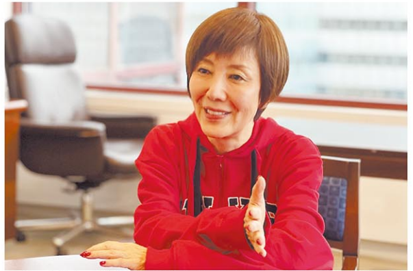
「カーネギーホールの楽屋入り口にはジュディ・ガーランドの写真が飾ってあるんですよ。そんな場所で公演できるなんて大変光栄です」

Profile：戸田恵子 NHK名古屋放送児童劇団に小学5年生から在籍し、ドラマ「中学生群像」でデビュー。1977年、声優・野沢那智主宰の劇団・薔薇座入団し看板女優として活動。阿劇団在籍中に芸術祭賞演劇部門賞、葦原英了賞を受賞。第24回紀伊国屋演劇賞個人賞(89年)、日本アカデミー賞優秀演技女優賞(97年)、第13回読売演劇大賞最優秀女優賞(2006年)、菊田一夫演劇賞(18年)など受賞多数。声優としても活動し「キャッツ・アイ」「それいけ!アンパンマン」などのアニメの他、洋画の吹き替えも数多く手掛ける。愛知県出身。