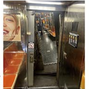
衝突の影響で連結がずれた車両/FDNYの公式X(@FDNY)より1月4日

アッパーウエストサイドで、地下鉄1番線の列車同士が衝突し、乗客24人が軽傷を負った。両列車が脱線し、1、2、3番線で運行に乱れが続いた。