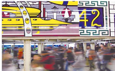
Times Square Mural (2002) by Roy Lichtenstein at NYCT 42 St-Times Square station.

彼は「アートは大眾のためにあるもの」と考え、一部の上流階級が行く美術館ではなく誰もが利用する地下鉄こそがキャンパスだった。とは言え公共物への損壊罪で逮捕されるため、駅から駅へと急いで走り描くという行為を1985年まで繰り返した。駅員に通報されて逮捕されることも。その後地下鉄の落書きは1994年にジュリアーニ市長によりニューヨークを安全都市に変える