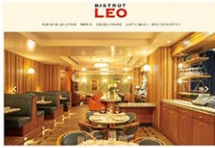
新型コロナウイルスの後、ビルのオーナーが変わった影響を受けて集まる Bistro LEO (Bistro LEOのウェブサイトから)

12月最終週から1月最初の週にかけて、NY市内でレストランやバー約40店が店を閉めた。値上がりや寒波で消費者の財布の紐がしまっている。