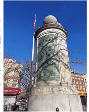
第一次世界大戦戦没者としてリッジウッド、 リッジウッド公園の記念碑

リクルートの一環として兵役の後、大学費用 を負担する仕組みがある。この制度を利用した 20代の若者3人に話を聞いたことがある。イラク などでの兵役で、2人が簡易爆弾で上官や同僚を 目の前で失った。1人は、雨の塹壕に閉じ込めら