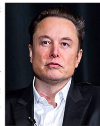
イーロン・マスク氏

【ニューヨーク共同】米短文投稿サイトX(旧ツイッター)のオーナーのイーロン・マスク氏は16日までに、新規利用者の投稿に少額の料金を課す構想を明らかにした。「ボット」と呼ばれる