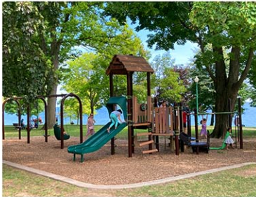
不登校児の増加は、教師が授業の速度を調整したりするため、登校している生徒の学習環境にも影響している。

学校は試行錯誤を続けている。オンライン授業を拡充し現実的な対応を行う学校も出てきた。教員が家庭を個別訪問したり、欠席日数を保