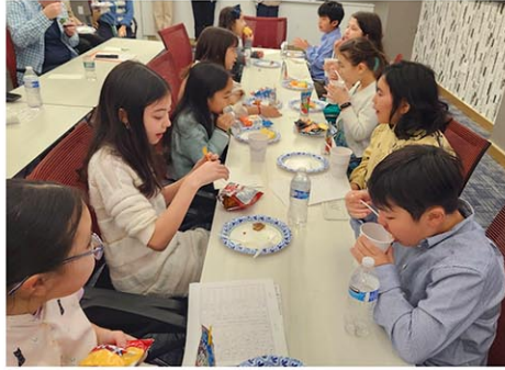
ビュッフェを楽しむ子どもたち

みんなが楽しめるには何をしたらよいか、アイデアを出して話し合い、最終的にはビュッフェをすることに決まった。決まっただけでもビュッフェで提供する食べ物は何にするか、どこで調達できるか、数量はどのくらいか、など実施に向けての準備は盛りだくさんだ。そのほかにも、新入生が楽しめるクイズを企画し、担当を割り振って準備や発表の練習を行った。学校のことを紹介するスピーチを作成したり、入学生に向けたメッセージを考えたり、当日のプログラムを作ったりと、