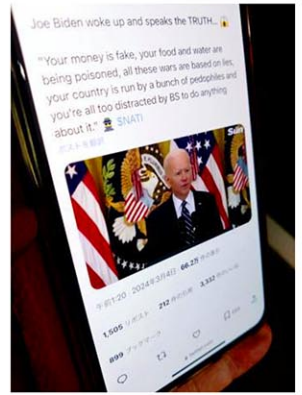
専用の生成AIサービスで制作しXに投稿されたバイデン米大統領の偽動画 = 1日、東京都内

レグラム」に投稿された。長さは14秒で「バイデンが目覚め、真実を語る」の説明文が付く。バイデン氏が記者会見で「戦争は全てうそに基づいており、国は小児性愛者が運営している」などと話す。Xでは4月1日時点で約66万回再生された。投稿者は「私は陰謀論者だ。動画は偽物だが、その中でバイデンが話している内容は真実だ」と主張した。(共同)