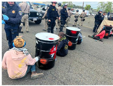
デモ参加者がゴールデンゲートブリッジを不法占領した様子 / California Highway Patrol (CHP) の公式 X (@CHP_HQ) からスクリーンショット = 4月16日

加者は金門橋の車線に車数十台を止めた。警察は安全のため全ての車線を封鎖した。近隣のオークランドの道路では、コンクリートを詰めたドラム缶を鎖で自身とつないで抗議する人もいた。