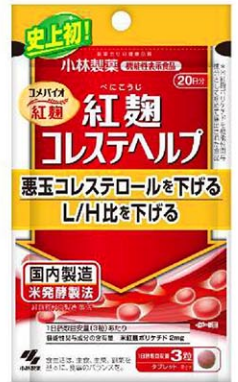
小林製薬のサプリメント「紅麹コレステヘルプ」（共同）

インテージは、問題が発表された翌週の3月25日から始まる1週間を対象に全国のスーパーやコンビニ、ドラッグストア約6千店のレジのデータから推計した。機能性表示食品のサプリの市場規模を示す販売総額は前年同時期と比べ7・7%減の8億7千万円となった。それまでは11週連続で前年を上回っており、問題の影響がうかがえる。小林製薬の紅こうじサプリと同様、コレステロール低減をうたうサプリで売り上げの