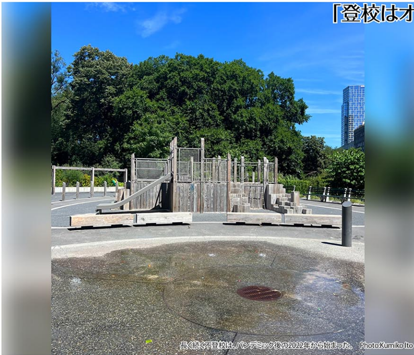
長らく不登校は、パンデミック後の2022年から始まった。