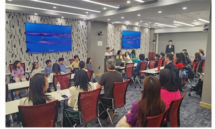
在校生が式を進行する

新入生も在校生も主役になる、大きなイベントとなった。「正直な話、子どもたちからビュッフェをやるつもりだと聞いた時、入学式でそれは非常識だと却下したくなった。しかし、教員一同子どもたちを信じ、実現できるように手助けすることに努めた。その結果、これまで私が経験した入学式で一番良いものになった。式を準備した在校生の表情が輝いていたのはもちろん、はじめて来