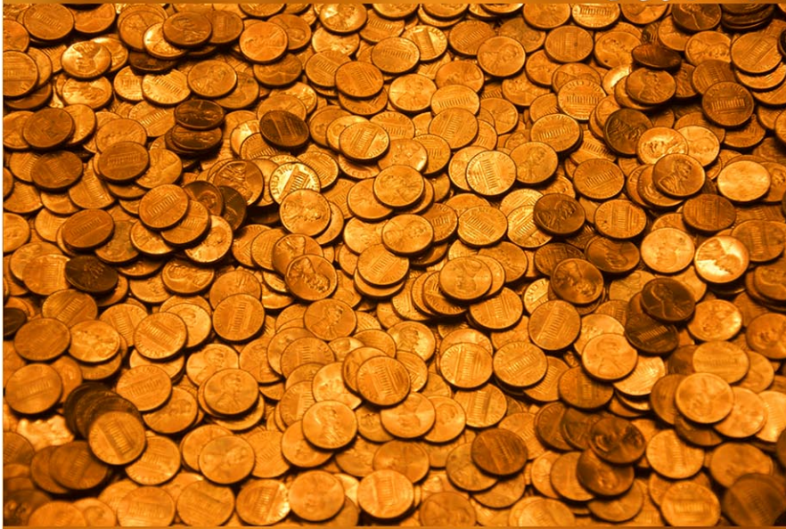
2017年、リワールドは毎年捨てられる数百万ドル相当のコインを回収する活動を開始。(写真はイメージ)

全米で硬貨が捨てられている。その金額は推定年間6800万ドル。サステナビリティを旨とするゴミ償却業者「リワールド」は7年前から硬貨を分別して今までに1000万ドルを回収した。