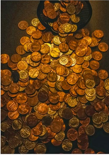
リワールドが回収した約1000万ドル相当のコインのうち、約400万ドルは損傷しすぎて使用できない。(写真はイメージ)

大手を振って使える場所も減り、硬貨の半分以上は家のどこかに眠っているという。買い物の代金を硬貨で払えば、レジの進行を止め、列に並んでいる他の客から怒られる「レジハラ」の懸念がある。硬貨計算機を置いている銀行は少ない。スーパーに設置されている「コインスター」で両替をすれば使用料を取られる。