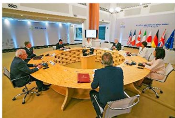
18日、イタリア・カプリ島で開催されたG7外相会合

議長国イタリアのタヤーニ外相は18日の協議の冒頭「イスラエルを支持するが、緊張緩和を望んでいる。イランにどのような制裁を科すのかについて協議する」と述べた。イタリア外交筋によると、イランの無人機やミサイルの生産に関与する組織や