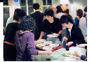
2012年 Discover Aomoriにて郷土料理をふるまう様子

人々が流動的なニューヨークにおいて、同郷ゆかりの人を集めるのは決して簡単なことではありませんが、現在約30名ほどの会員があり、音楽家や美術家、料理人と個性豊かなメンバーが揃っています。毎年開催される交流会では、県出身者と同県ゆかりの方々をお迎えして、郷土料理をベースにしたお食事と音楽を楽しんでいただくのですが、参加者からは、北東北らしい穏やかでゆったりとした時間の流れる空間に、ニューヨー