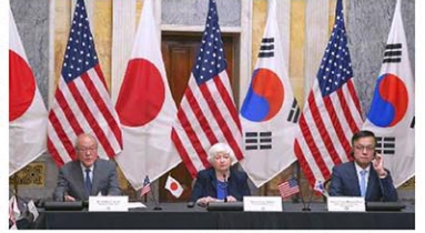
ワシントンで初の日米韓財務相会合に臨む(左から)鈴木財務相、イェレン米財務長官、崔相穆・韓国経済副首相兼企画財政相=17日(共同)

【ワシントン共同】日米韓は17日(日本時間18日)、初開催した財務相会合の共同声明を発表し「最近の急速な円安、ウォン安に関する日韓の深刻な懸念を認識する」と表明した。3カ国の財務相が外国為替相場を巡って一致した見解を文書で示したのは初めて。日米欧の先進7カ国(G7)の財務相・中央銀行総裁会議も「為替レートの過度の変動や無秩序な動きは経済、金融の安定に悪影響を与え得る」とする2017年の合意を再確認し、声明に明記した。