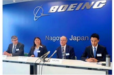
研究開発拠点を名古屋市に開設し、記者会見する米航空機大手ボーイングのトッド・シトロン最高技術責任者(右から2人目)ら=18日午後、名古屋市(共同)

拠点の名称は「ボーイング ジャパン リサーチセンター」。航空機の製造や検査時に、人が作業しにくい狭い空間で使うロボットの活用方法の研究を進める。また、部品を製造する企業の業務サポート