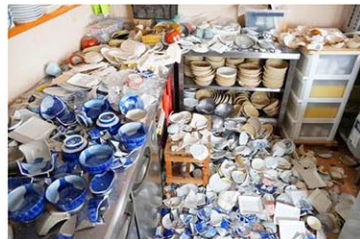
地震で食器が散乱した、愛媛県宇和島市の居酒屋＝18日午後0時42分

愛媛、高知両県で震度6弱を観測した地震で、両県と大分県で確認された負傷者は18日、重傷2、軽傷10の計12人となった。各地で断水や建物の損壊、落石による道路の通行止