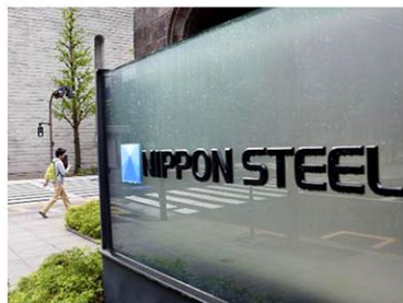
日本製鉄本社が入るビル前の看板=東京都千代田区

日鉄の高度で持続可能な鉄鋼製品の提供を通じて「米国内産の強靱化を果たし、中国の脅威に対抗して日本との関係を強化する」と強調。