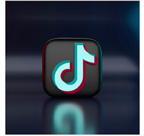
TikTok(ティックトック)の禁止法案を超党派が可決。

【ワシントン共同】米上院は23日、中国系動画投稿アプリ「TikTok(ティックトック)」について、運営側が米国での事業を期限内に売却しなければ、全米でアプリ配信を禁じる法案を超党派で可決した。下院は既に通過しており、バイデン大統領が24日に署名し、同法が成立した。米国でティックトックが禁止される可能性が高まった。 中国政府の情報収集や世論操作に悪用され、安全保障上の脅威になると懸念される一方、禁止は言論の自由に反するとの見方も出ていた。 米メディアによると法律は、ティックトック運営企業の親会社、北京字節跳動科技(バイトダンス)に発効から約9カ月以内に米国事業を非中国企業に売却するよう要求。従わなければ米国での