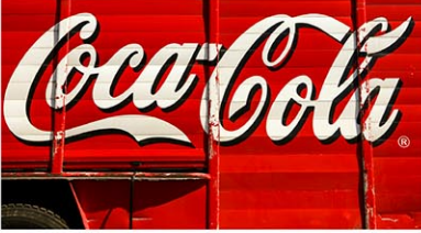
マクドナルドのコカ・コーラのみディアムドリンクには56グラムの砂糖が含まれている

(P1からつづく) 米農務省 (USDA) は1日の加糖を50グラム未満、または標準摂取2000カロリーの10%未満に抑えるよう推奨している。マクド