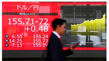
一時1ドル=155円70銭台を付けた円相場を示すモニター。約34年ぶりの円安ドル高水準を更新した=25日午後、東京都中央区

24日の海外市場で1ドル=155円を突破した後も円安が止まらない。FRBの利下げ開始が遅くなるとの観測