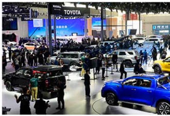
中国・北京で開催した自動車展示会「北京国際モーターショー」=25日

【北京共同】世界有数の自動車展示会「北京国際モーターショー」が25日、中国・北京で開幕した。電気自動車（EV）の普及が急速に進む巨大市場で商機をつかもうと、国内外の自動車メーカーが集結し、最新車両を披露した。台頭著しい中国ブランドに対抗するため日系各社も戦略車を相次いで投入し、巻き返しを図る。