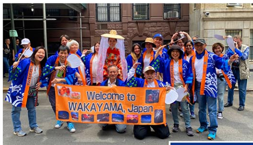
Japan Parade 2023

そんな「和歌山」が好きな人、「和歌山」にゆかりのある人で構成されているのがニューヨーク和歌山県人会です。メンバーは約30名。毎年Japan Paradeに参加し、和歌山の高校とのZoom交流や和歌山からニューヨークに進出したい企業との会議、他の関西の県人会とのコラボ企画「近畿連合」のイベント、4年に一回開催される和歌山市での和歌山県人会世界大会への参加等、幅広く活動しています。今年5月11日（土）に開催されるJapan Paradeにも