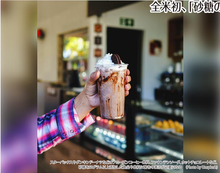
スターバックスやタンキンドーナツなどのフローズンコーヒー飲料、フアウンテンソーダ、ホットチョコレートなど、砂糖を50グラム以上が加した食品や飲料に警告の表示が必要となる。

ニューヨーク市保健局 (DOH) は、50グラムを超える添加糖含有メニューアイテムに警告表示をファーストフード店などに義務付ける。全米初の試みだ。