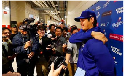
ナショナルズ戦の前、報道陣の取材に応じるドジャース・大谷=ワシントン

【ワシントン共同】米大リーグ、ドジャースの大谷翔平選手が24日、ワシントンでの試合前に報道陣の取材に応じ、通訳だった水原一平氏が違法賭博問題で解雇さ