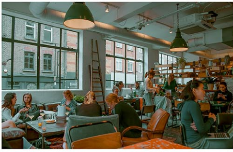
予約競争がこれまで以上に激化し、食事時間を早める人が増えた

ニューヨーク市のレストランで、ランチ営業を始める店が増えてきた。ターゲットは、昼間にゆったり食事をする時間があり、金銭面の余裕もあるホワイトカラーだ。