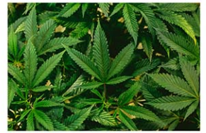
大麻を乱用リスクがより低い薬物に分類する

11月の大統領選に向け、バイデン氏は若年層の支持拡大につなげることを狙う。20年の前回大統領選では、大麻の