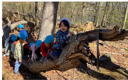
みんなでバランス木登りに挑戦

又、森の中に自然に出来た広場では自由に遊ぶ時間を持ち、普段なかなか経験することができない、ゴツゴツした石の上や落ち葉の上を歩く経験をしたり、倒れ