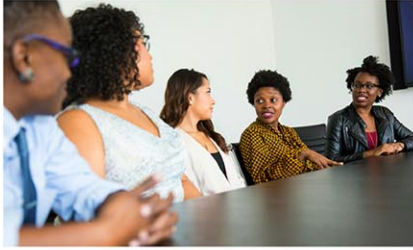
アジア系や黒人、ラテン系などの有色人種は、白人よりも1ドル当たりにつき平均16セント少ない写真はイメージ

ニューヨーク市職員の給与を巡り、白人と有色人種の間における格差が広がっている。アジア系や黒人、ラテン系などの有色人種は、白人よりも1ドル当たりにつき平均16セント少なくなっており、有色人種の女性間での差はさらに広がっている。