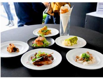
お披露目された、パリ五輪の選手村で出される料理=4月30日、パリ

ン、スパイスが効いた地元産の白身魚などメニューは多彩。「フランス」「世界」「アフリカ、カリブ海」「アジア」とさまざまな分野から選べ、毎日用意される40種類のメイン料理のうち3分の1を「完全植物性」にする予定。