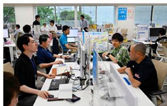
クールビズが始まり、ポロシャツなどの服装で仕事をする環境省の職員ら=1日午前、東京・霞が関

環境省は、気候の地域差を考慮し、2021年度以降、全国一律の期間設定を取りやめたが、省としては1日から9月末までを集中取組期間としている。