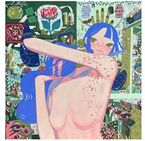
Akie Abe "Me and My Life I"

5/8(水)~5/12(日) 5/15(水)~5/19(日) 12:00~18:00 One Art Space Gallery 23 Warren St. (bet. Broadway & Church Sts.) 無料