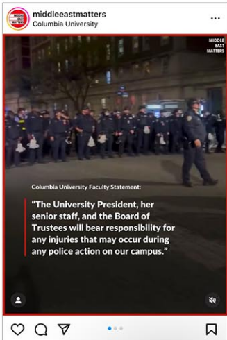
4月30日未明、キャンパス内に隊列で突入する警官隊。