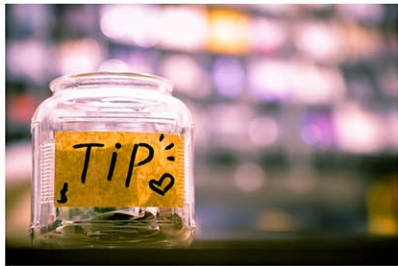
ニューヨークでは客に法外な額のチップを支払わせようとする動きが強くなっている

ニューヨークは、法外なチップの要求にうんざりしている。最近の報告書によると、物価高騰により日常生活にかかるコストが上昇を続ける中、米国の消費者の66%以上が、必要最低限のお金以外は使いたくないと感じている。しかし、飲食店などのサービス従事者が、礼儀正しさを能力レベルなどのサービスの質に関係なく、客に法外な額のチップを支払わせようとする動きは、ここ数カ月で強くなっているようだ。 4月3日～8日にわたり、2千人を対象として実施した調査によれば、米国人はこの1年間に、意図していたより5百ドル近く余分にチップを