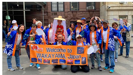
Japan Parade 2023 (NY和歌山県人会)

連絡先: E-メール (hiroshima.newyork@gmail.com) Amanoまで