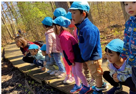
春の光が当たるきれいな湖に蛙を発見！

暖かな春の日差しの中、園児達はクラスごとにホワイトトレイル散策を楽しんだ。森に隣接している湖の畔を歩くこのコースで、子ども達は大木の年輪を観察したり、動物の住処のような穴を見つけたり、湖にいる蛙を観察したりと、自然ならではの発見をたくさんしていた。