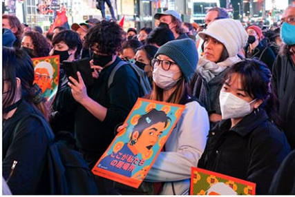
2021年に行われたアジア系住民への集会の様子 (ホーカルの記事の公式X (@GovKathyHochul) = 2021年3月)

(P1からつづく)アジア系住民を標的としたヘイトクライムは2021年から22年にかけて減少した。しかし回答者の61%が昨年は増加したと