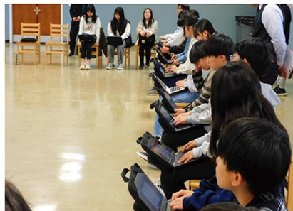
議案書はペーパーレス化され、モニターや各自のデバイスで対応

な活動内容の提案が続いた。会の進行を中中部議長が務める中、初等部からも積極的な質問が続き、より良いニュージャージー日本人学校づくりへの関心の高さを示していた。また議案書はペーパーレス化され、モニターや各自のデバイスで対応している。途中低学年児童もオブザーバーとして参加し、お兄さん・お姉さん