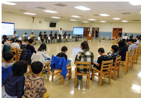
児童総会での様子

続いて、そのテーマを受け初等部委員会からは、レクリエーションの時間や昼の放送等を通じて「毎日が楽しく、明日も通いたくなるような学校生活づくり」を目指した具体案が次々と発表された。組織改編をした中等部からは、学力向上、安全安心、学校のけん引役等に向けた魅力ある新鮮