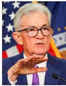
記者会見する米FRBのパウエル議長=1日、ワシントン

【ワシントン共同】米連邦準備制度理事会(FRB)は1日、連邦公開市場委員会(FOMC)で主要政策金利を5・25~5・5%で据え置くことを決めた。金利の維