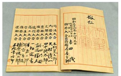
日本国憲法の公布原本

共同通信社は1日、憲法記念日の5月3日を前に憲法に関する郵送方式の世論調査結果をまとめた。岸田文雄首相が9月までの自民党総裁任期中に意欲を示す憲法