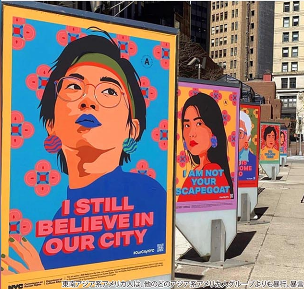
東南アジア系アメリカ人は、他のどのアジア系アメリカ人グループよりも暴行、暴言、脅迫に直面している

STOP ASIAN HATE stopasianhate New York City, N.Y.