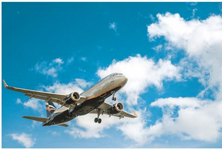
航空便の欠航や大幅遅延での返金が義務化される (写真はイメージ)

米運輸省は4月24日、航空便に欠航や大幅な遅延、変更があった場合、客への払い戻しを航空会社に義務付ける最終規則を発行した。代替交通手段や旅行クレジット、バウチャーによる補償の提供がない場合、また客がこれらを拒否した場合に適用されるもので、米国発着、米国内で運航する国内外航空会社の乗客が対象となる。 規則が適用されるケースは①欠航②出発や到着時刻の大幅な変更(国内線は3時間以上、国際線は6時間以上)③予約空港とは別の空港への到着・出発④下位クラスへの格下げや困難な乗り継ぎ、機材変更、乗り継ぎ回数の増加な