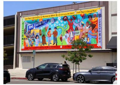
米ロサンゼルスのリトルトーキョーにある壁画「ロサンゼルスの小東京は我々の心の故郷です」と日本語で書かれている=1日(共同)

【ロサンゼルス共同】米民間非営利団体「歴史保護ナショナル・トラスト」は1日、約140年の歴史があるロサンゼルス中心部の日系人街リトルトーキョーを存続の危機にある歴史地区