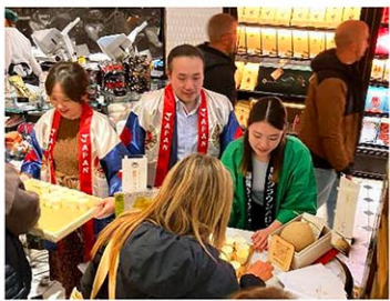
ロンドンの高級百貨店ハロッズでの静岡クラウンメロンの試食販売＝4月

【ロンドン共同】ロンドンの高級百貨店ハロッズで昨年12月に日本産果物の販売が始まり、好調な売れ行きを見せている。先月下旬からは静岡県産のクラウンメロンが店頭