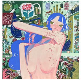
Akie Abe "Me and My Life I"

5/8(水)~5/12(日) 5/15(水)~5/19(日) 12:00~18:00 One Art Space Gallery 23 Warren St. (bet. Broadway & Church Sts.) 無料