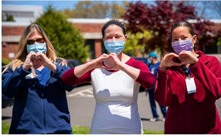
全米で6日から、全国看護師週間がスタート

全米で6日から、全国看護師週間がスタートする。看護師への愛と感謝を示す機会となり、チポトレやダンキンなどのレストランやチェーン店は、割引やクーポンを提供する。ただ、医療従事者の大部分を占め、病院における患者への主な医療提供者である看護師が求めるものは、感謝や割引よりも、その過酷な労働条件の改善だ。