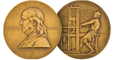
ピューリッツァー賞のメダル

【ニューヨーク共同】米コロンビア大は6日、優れた報道をたたえる今年のピューリッツァー賞を発表し、特別賞に特定の社や個人ではなくパレスチナ自治区ガザ情勢取材する全ての記者らを選んだ。選考委員会は、数多くのジャーナリストがパレスチナ人や支援関係者の記事を伝えるために命を落としたと指摘し「悲惨な状況下での勇敢な功績」を称賛した。