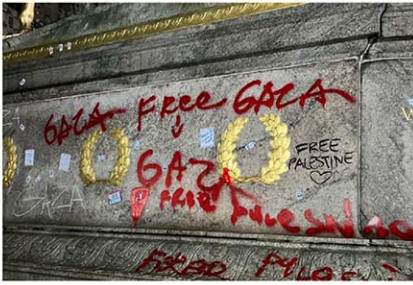
東67丁目付近にある記念碑の礎石 / ニューヨーク市警副本部長カズ・ドートリーの公式X (@NYPDDaughtry) = 5月7日 / ニューヨーク市警副本部長カズ・ドートリーの公式X (@NYPDDaughtry) = 5月7日

デモ隊はさらに北上を試みたが、東79丁目で警官隊に阻まれた。パレスチナの伝統的スカーフで白黒の織物「ケフィエ」で顔を覆った参加者は「私たちはやめない、休まない」などとシュプレヒコールを繰り返す。その後、警官隊ともみ合いになって、20数名が逮捕されている。