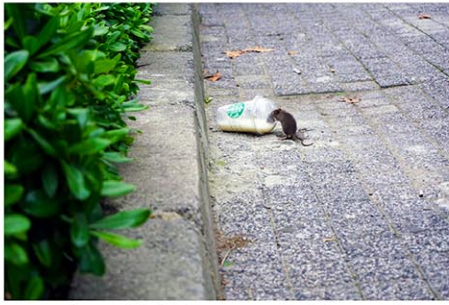
ネズミの目撃情報が前年比で14%近く減少 (写真はイメージ)

ニューヨーク市内で、市民を悩ませてきたネズミの目撃情報が激減している。市衛生局によれば、過去13カ月のうち、前年同月比でみると、12カ月で減少し、ハーレムやチャイナタウンなどネズミが多い地域でも前年比で14%近く減っている。ハミルトンハイツでは、目撃件数が55%減少し、劇的に改善している。アダムズ市長は2022年の就任時、「ネズミは公共の敵ナンバーワンだ」などとして、追放することを宣言。本格的な駆除に乗り出したのが、功を奏しているとみられる。衛生局の関係者は、目撃情報の減少を巡り、アダムズ氏が毎日