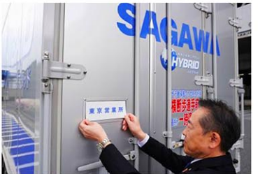
佐川急便のトラックに付けられる営業所名札。4月、東京都江東区(共同)

プライバシーを守って働きやすい業界に。物流大手の佐川急便が全国の自社トラックに掲示していたドライバーの名札を廃止した。運転マナーの向上を目的に30年以上前から行ってきたが、交流サイト(SNS)で名前を拡散される恐れや、女性ドライバーからの不安の声を受けて取りやめた。 佐川急便は2月からトラックや軽バン計約2万6千台の後部に付けていた名札を試験的に外し、3月に