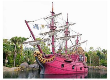
東京ディズニーシーでお披露目された「ファンタジースプリングス」の「ピーター・パン」を題材にしたエリア。7日午前、千葉県浦安市

東京ディズニーシー(TDS、千葉県浦安市)の新エリア「ファンタジースプリングス」が6月6日に開業するのを前に、運営会社のオリエンタルランドは7日、現地を報道陣にお披露目した。