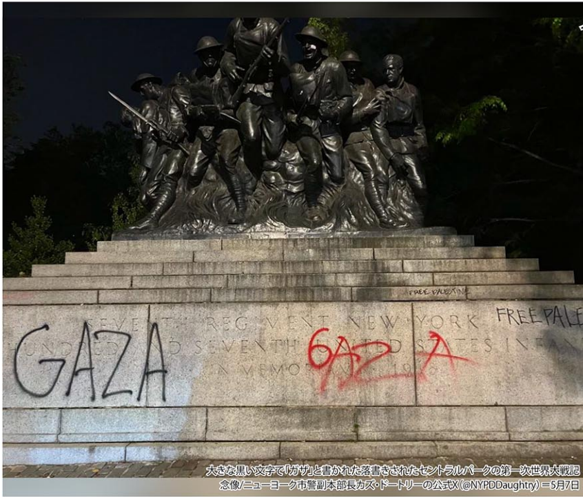
大きな黒い文字で「ガザ」と書かれた落書きされたセントラルパークの第一次世界大戦記念像/ニューヨーク市警副本部長がストードリーの公式X (@NYPD Daughtry) = 5月7日