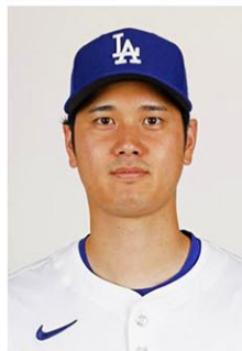
大谷翔平選手

【ロサンゼルス共同】米大リーグ、ドジャースの大谷翔平(29)が6日、前週に好成績を残した選手を表彰するナショナルリーグの週間MVPに選ばれた。昨季まで在籍したアメリカンリーグのエ