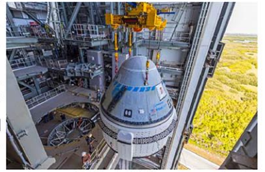
4月、フロリダ州からの打ち上げ前にアトラス5ロケット上部に据え付けられるスターライナー

【ケーブルカナベラル共同】米航空宇宙局(NASA)は6日、同日夜に予定していたボーイングの新型宇宙船「スターライナー」の打ち上げを延期すると発表した。打ち上げに使うロケットに