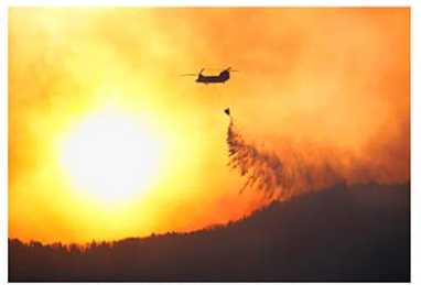
朝日が昇る岩手県大船渡市赤崎町で、山林火災の消火活動を行う自衛隊のヘリコプター。市面積の約8%が焼失した=4日午前6時39分(共同)

岩手県大船渡市の山林火災は5日で発生から1週間。2月26日の出火から4日午前6時まで市面積の8%に当たる約2600ヘクタールを焼失、鎮火のめどは立っていない。市民4596人