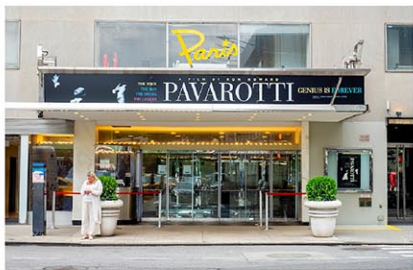
42位にランクインしたパリスシアター

タイムアウト が選んだ「世界で最も美しい映画館50選」のランキングに、ニューヨーク市の映画館3館が名を連ねた。同サイトが2月27日、伝えた。