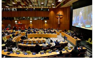
開幕した核兵器禁止条約の第3回締約国会議＝3日、米ニューヨークの国連本部

米国の「核の傘」に頼る日本は条約に参加しておらず、被爆者らからオブザーバーとして会議出席を求められたが、核抑止力を重要視して参加を見送った。北大西洋条約機構(NATO)加盟国で、第1回、第2回にオブザーバーとして参加