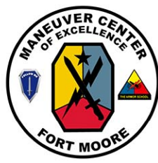
フォートムーア基地のロゴマーク

【ワシントン共同】ヘグセス 米国国防長官は3日、南部ジョージア州のフォートムーア基地について、旧称の「フォートベニング基地」に戻す覚書に署名した。先月も別の基地の旧称を復活させていた。フォートベニング基地は南北戦争で奴隷制を支持した南軍のベニング将軍の名前にちなみ、奴隷制の容認を想起させるとしてバイデン前政権が改称していた。ヘグセス氏は、今回はベニング将軍ではなく、第1次大戦中に欧州で武勲を立てたフ