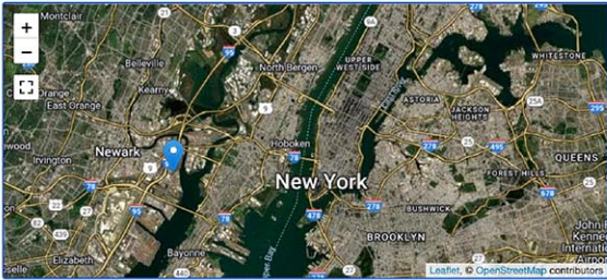
収容施設となるデラニーホール。グローバル・ディテンション・プロジェクトの公式ウェブサイト (https://www.globaldetentionproject.org/) から (Map: Leaflet, © OpenStreetMap contributors)

連邦移民当局は、トランプ大統領の2期目初となる新しい移民収容施設をニュージャージー州ニューアークにオープンする。北東部におけるICEの収容能力拡大が目的。 ゴッサミスト が2月28日、伝えた。