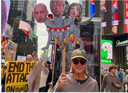
現政権に対して声を上げる抗議活動は健在だが、民主主義を脅かす動きはアメリカ社会のあらゆる分野に及んでいる (2025年10月18日、マンハッタン)

スウェーデンのヨーテボリ大学を拠点とする世界有数の研究グループ、民主主義の多様性研究所 (V-Dem) が毎年発表する「 デモクラシーレポート(民主主義に関する報告書) 」2026年度版がこのほど発表され、研究者たちは「アメリカで現在、民主主義が解体されているスピードは近代史において前例のないもの」で、アメリカの表現の自由は「第二次世界大戦終結以来、最低水準にある」と断じた。CNNなど主要メディアが18日、伝えた。 報告書では、アメリカを含む43カ国が「独裁化」している一方で、民主化が進んでいるのはわずか12カ国にとどまると結論付けた。研究者らは詳細なデータセットをまとめ、計202の国と地域について「自由民主主義指数」のスコアを算出。報告書では現状を「人