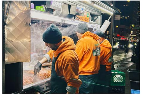
ニューヨーク在住の日本人の7割がデリバリーを利用したことがあると回答

“デリバリー文化の中心地”ともいえるニューヨーク。本紙では、日本在住者を対象にアンケート調査を実施し、 デリバリー利用の実態 を調べた。