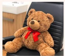
以前は待合室に置いていたというクマのぬいぐるみ。遊馬先生ならではの細やかな配慮

また、患者さんが急かされていると感じることがないように、患者さんの数を調整してしっかりと話を聞く時間を確保するようにしています。医療は検査や治療だけでなく、患者さんが「話せる」「受け止めてもらえる」と感じられることも非常に重要なポイントです。以前は待合室に、触ったり抱いたりして気持ちを落ち着けられるクマのぬいぐるみを置いていたこともありました。これらは小さな工夫ですが、それだけで緊張が和らぐ人もいます。こういう積み重ねが大切だと感じています。