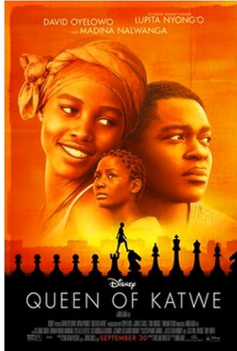
Queen of Katwe (2016)の映画ポスター

優先順位付き投票は、2021年からニューヨーク市で導入された新しい投票方法である。従来のように1人の候補者へのみ投票するのではなく、有権者は最大5人までの候補者を、順位を付けて選ぶことができる。ゾーランは順位選択集計で56.4%を獲得