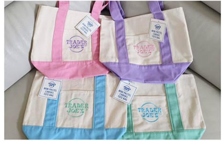
イースター限定4色の中で特に人気なのはラベンダーカラー。3月末には大きめサイズの登場も予定しているという

トレーダー・ジョーズ(以下トレジョ)に今年もイースター限定の pastel カラーのミニエコバッグが登場した。朝、偶然立ち寄ったトレジョで長蛇の列を目にし、「もしかして今日が発売日では？」と思い、筆者もその列の最後尾に並んだ。