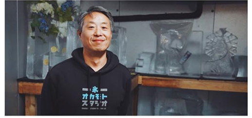
クイーンズ・アストリアにある岡本スタジオで

の修士号を取得しました。その間も父の彫刻デザインは手伝っていたのですが、いざ大学院を修了し進路を決めるタイミングが来た時に、教授の道に進んで決して高い報酬の中で厳しい競争の世界に入るのか、それとも自分で何かを始めるのか、迷っていました。そして最終的に親父と「一緒に何かやってみよう」となり、立ち上がったのが岡本スタジオの始まりですね。