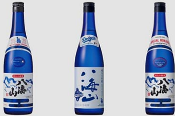
ドジャース優勝を祝して発売された記念ボトル

アメリカでの展開に加え、日本国内でも影響は「想像以上」だったという。八海山を代表する「特別本醸造」は、通常の茶色いボトルに加え、ドジャースのチームカラーであるブルーの記念ボトルを発売。さらに昨年のナ・リーグ優勝、ワールドシリーズ優勝のタイミングでも記念ボトルを発売し、いずれも関心を集めた。