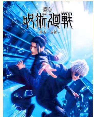
ジャパンパレードへの参戦が決定した舞台「呪術廻戦」

今年のジャパンパレードには、舞台「呪術廻戦」のキャストが特別ゲストとして来米する予定だ。「日本の伝統文化・芸能をテーマにしたパフォーマンスに加えて、舞台『呪術廻戦』のアクターさんが来米する予定です。なお、同作の舞台版の日本国外でのお披露目は初めてと聞いています」