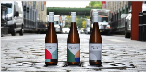
ニューヨーク発の酒蔵「ブルックリン・クラ (Brooklyn Kura)」

Hakkaisanは日本での酒造りと並行して、「SAKEを世界飲料に」をスローガンに掲げ、海外でのSAKE文化の発信にも力を入れてきた。アメリカの西海岸ではドジャース、そして東海岸ではブルックリンにあるニューヨーク初の酒蔵として知られる「ブルックリン・クラ (Brooklyn Kura)」と協業している。