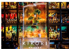
ワイスキーブランド「KIKORU」のコーポレーション氷彫刻