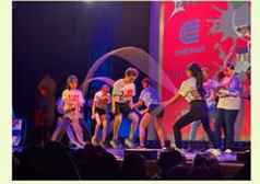
ダブルダッチ部のスピード競技