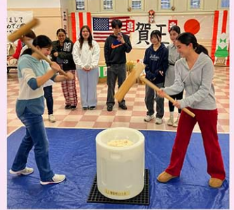
全校もちつき大会で日本文化を体験

ていきます。どの国や地域で活躍することになっても、ここで過ごした日々が、その人の背骨になっていくはず。