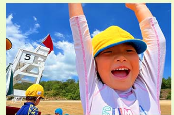
サマースクールでのびのびと遊ぶ幼児部の子どもたち

今後は、ますます現地コミュニティとの協業を通じて、ニューヨークならではの教育価値を高めるとともに、日本の教育機関との連携を通じて、より