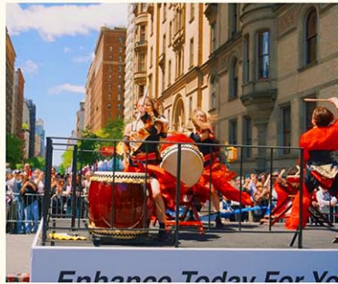
2025年にニューヨークで開催されたジャパンパレード

「第5回という節目でもありますし、これまで築いてきた基盤を生かしながら、新たなステージに進みたい。5月の風物詩として定着できるようにしていきたい」。彼らが強調したのは「定着」という言葉だった。