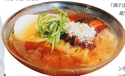
「ベーコン・フライド・エッグ & チーズ・ラーメン」 だしのコク深さにチーズや卵のまろやかさが絡み合う

「調子はどう？」「今週お誕生日でしょ？おめでとう！」「前にも来てくれたたよね？、また会えてとてうれしいわ」 「大好きなラーメンを自分で作り、友達に振る舞っていたのが始まりだったので、