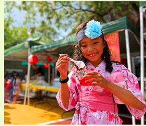
サマースクールでの幼児部・小学部の雑日