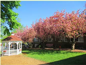
ニュージャージー校舎の外観

ニューヨーク育英学園は、ニューヨーク・ニュージャージーエリアに4つのキャンパスを構え、主な拠点となるニュージャージーキャンパスは独自の施設と広々とした校庭を有する点が大きな特徴です。豊かな自然環境の下、きめ細