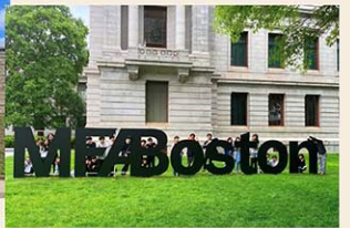
ボストンでの宿泊学習 (中等部)