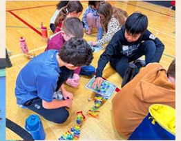
学校間交流も盛んに実施 (初等部)