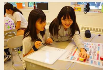
授業では、言葉を使って考えることを優先している

学校の運営はPTO活動で支えられており、授業参観などの行事への保護者参加率はほぼ100%です。