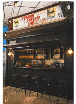
現店舗を構える前、バウリーマーケット (Bowery Market) でポップアップをしていた頃