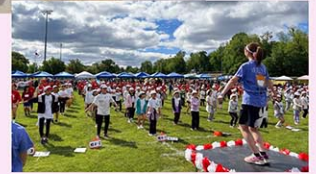
全校生徒が集まる運動会

して国際学級まで約400人の児童生徒が集い、リレーや綱引き、玉入れなどの競技に全力で取り組みます。親子競技も行い、学校全体が一体となる活気あふれる一日です。