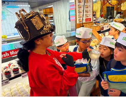
地元密着型の校外学習

また、校外学習や学校間交流などを通して、学んだ英語を実際に使う機会を積極的に設けています。