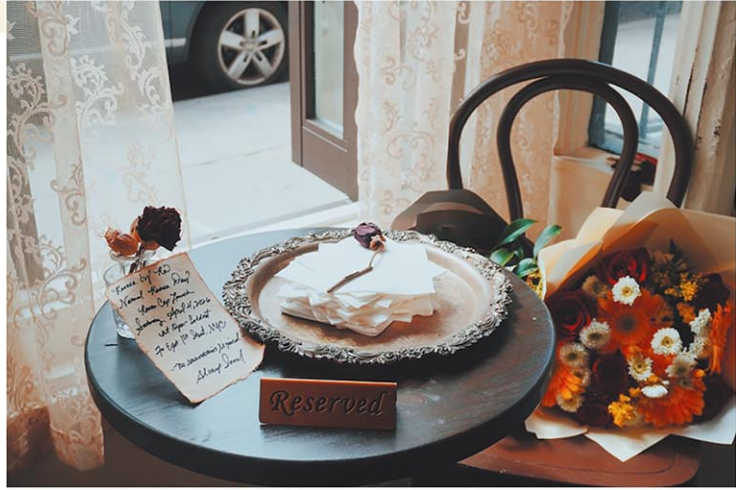
ラーメン店とは思えないような愛らしい内装。最近ではこの「窓」を使った持ち帰りサービスもスタートした