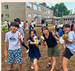
恒例・夏の水鉄砲大会