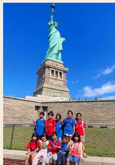
リバティ島へ遠足 (初等部)