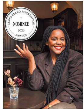
1991年から続く、名誉あるジェームズ・ビアード財団のライジング・スター・シェフ賞 (James Beard Award for Emerging Chef) で、ファイナリストにも選出された