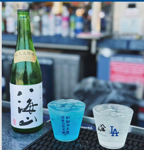
ドジャーススタジアムで販売されている Hakkaisan の日本酒