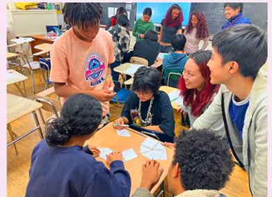
自分の考えを伝え合いながら学ぶ子どもたち

補習校はこれまで、帰国後に日本の学校や生活へ円滑に適応できるよう支援することを主な目的としてきました。