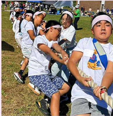
赤白に分かれて競う運動会

勞を知っている仲間と過ごす時間は、子どもたちの心の安定につながり、やがては一生続く友情へと育っていきます。