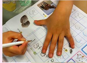
副教材でひらがなの練習

アイデンティティを自分の言葉で語れる力につながります。単に外国語が堪能というだけでなく、自国の言語・文化・習慣をしっかりと身に付けたい。そんな文化も理解し尊重できる。そんなバランスの取れた人間へと育