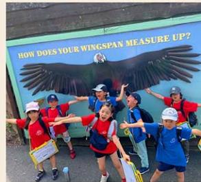
タートルバック動物園への遠足 (初等部)

PTO(PTA)が中心となり、夏祭りやホリデーイベント、ランチ企画などを実施しています。