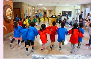
日本文化に触れるイベントも多数開催

5月に開催する運動会は、本校を代表する一大行事の一つです。広々としたフィールドに幼児部から高等部そ