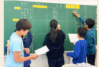
インタラクティブな学びを重視

に進む生徒もいます。世界を広くとらえ、夢を大きく語りながら、熱心に着実に取り組む生徒が多いのも本校の特徴です。