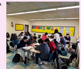
中・高等部の授業

補習校では年に2度の漢字検定に加え、借用校で実施されるAP Japanese試験は、ニュージャージー補習授業校の在校生のみが受験できるため、現在通っている現地校では受験できない生徒にとって、大きな利点となっています。また今後は、地域の日本人コミュニティや企業、教育関係者との連携をさらに深め、子どもたちが社会とつな