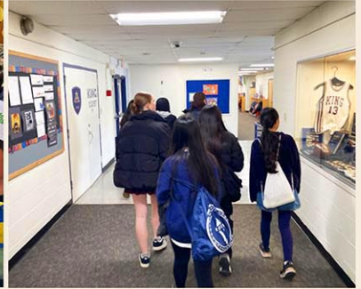
現地校との交流学習