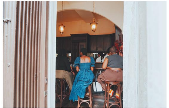
店内は4席のみ。自然と横にいる人との会話も生まれる

「ポップアップを経て、新しいロケーションでスタートして約5カ月が経ちましたが、ずっと来てくれてる常連が5割、また新しい人たちが5割といった感じで、お客様のバランスがとてもユニークなんです。また、お店が小さいこともあって、常連さんたちは近況を話し合い、新しく来た人も隣に座った人との会話を楽しめる。あえて