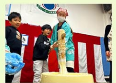
餅つき大会でリーダーシップを発揮する6年生

びドライブスルー方式を採用。広いエリアからの通学が可能です。昼食は弁当持参が基本ですが、希望者には注文制の昼食も提供しています。放課後は器械体操、ダブルダッチ、水泳、野球、サッカー、ダンス、音楽、英語など多彩な活動を実施し、学年を超えた交流も活発です。特にダブルダッチ部は世界大会で優勝の実績を持ち、学園を象徴する取り組みの一つとなっています。