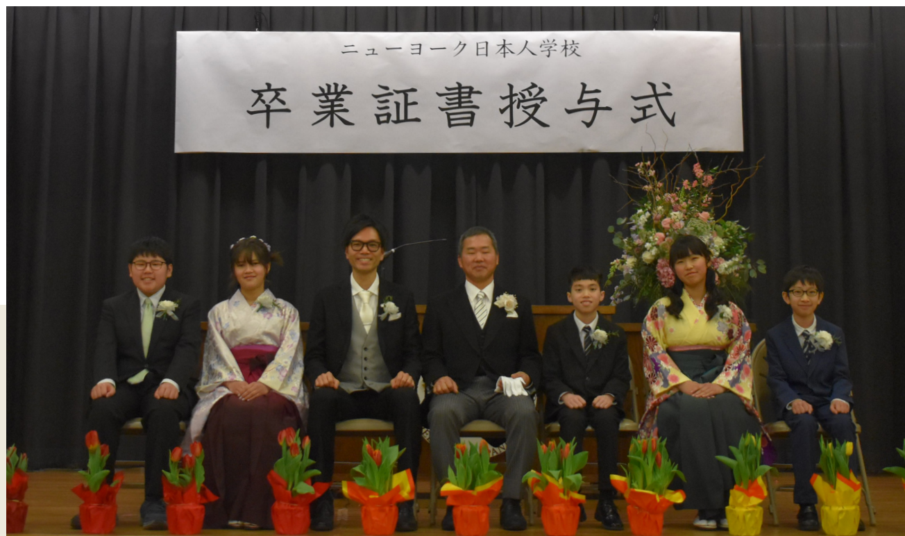
晴れやかな表情の初等部卒業生

新たな道へ進む卒業生が、それぞれの夢や目標に向かって大きく羽ばたいてくれることを願っている。（情報・写真提供：ニューヨーク日本人学校）