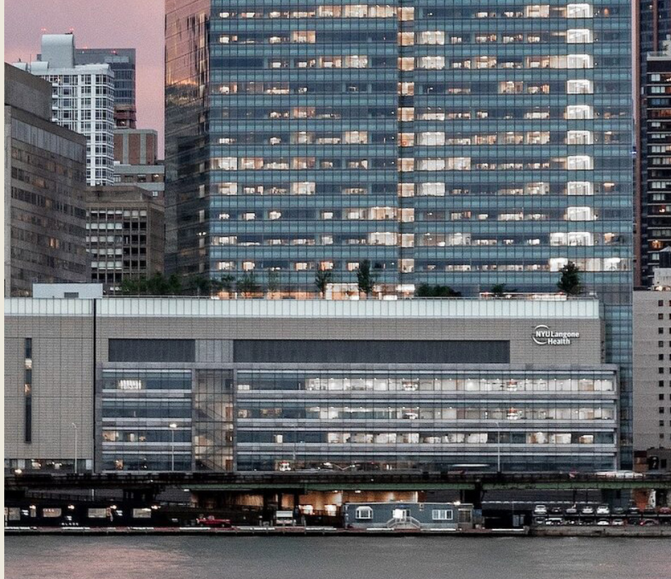
NYU ランゴンヘルス