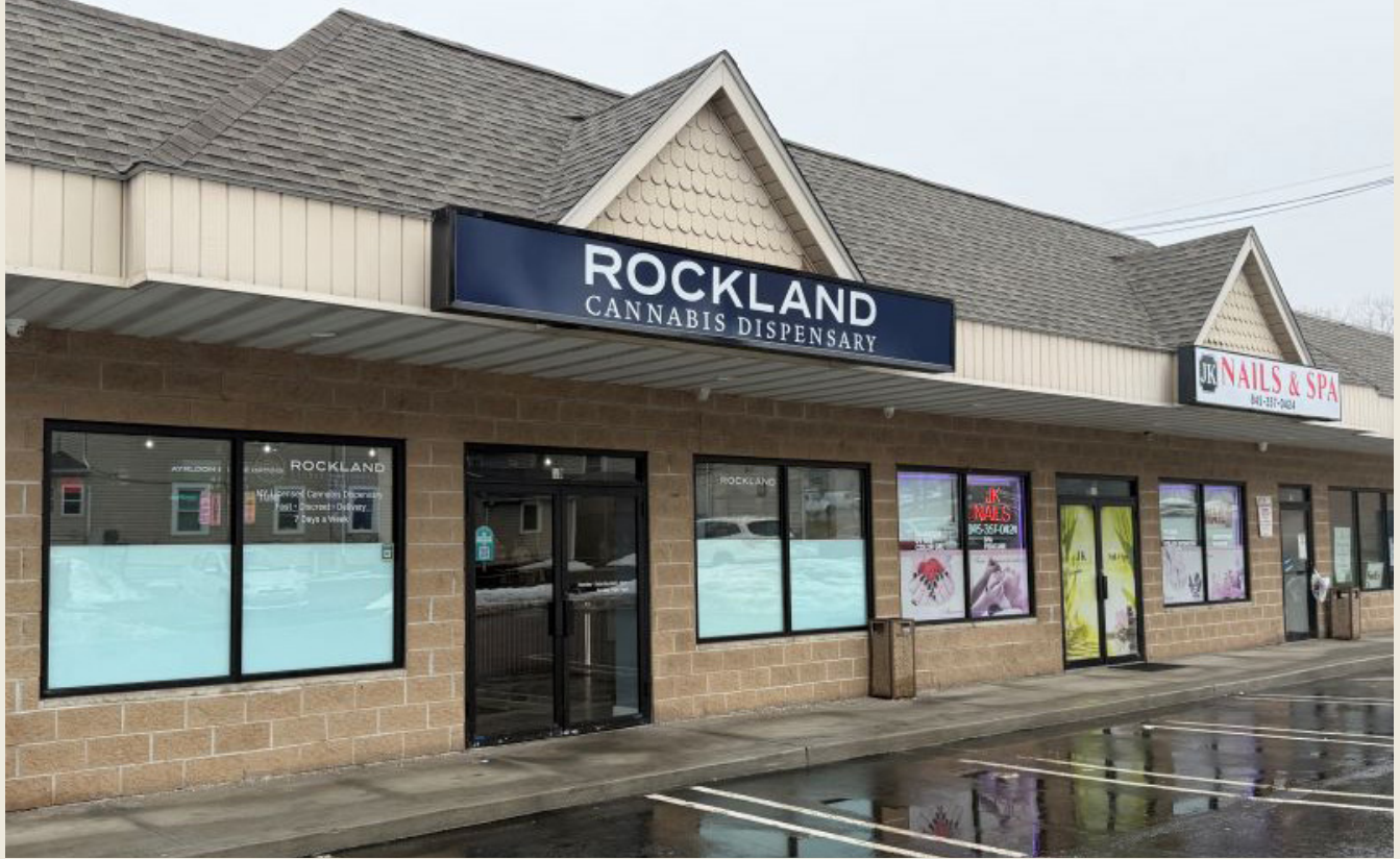
ニューヨーク市内はもちろん、郊外でも日常的に大麻販売店（Cannabis Dispensary）を見かける