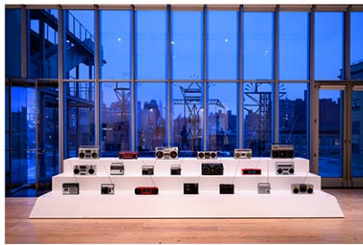
ホセ・マセダ/恩田晃 - マルチチャンネル・サウンド・インスタレーション Installation view of Whitney Biennial 2026 (Whitney Museum of American Art, March 8 - August 23, 2026) Jose Maceda and Aki Onda, Ugnayan, 1874/2026.

1890年代になると、アメリカでは「マニフェスト・デスティニー(明白な天命)」という思想が広まり、欧州諸国に対抗するために海外植民地を持つ海軍大国になるべきだと考えられた。1898年キューバの独立運動をきっかけに始まった米西戦争(約4か月間)時、海軍次官で拡張主義者だったセオドア・ルーズベルトがマニラ湾で老朽化したスペイン太平洋艦隊を壊滅させた。その結果、パリ条約(1898年)によりスペインはフィリピン全土の主権を放棄し、