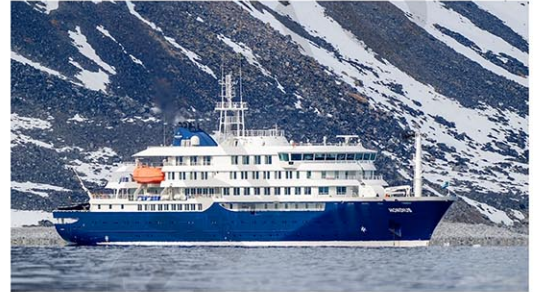
スビッツベルゲン島（ノルウェー領）で2025年6月、撮影されたMVホンディウス号

南米アルゼンチン発のクルーズ船で発生したハンタウイルス集団感染（乗客148人のうち3人が死亡、8人の感染を確認）を受けて、ニューヨーク市保健精神衛生局(DOH)は8日、 公式見解 を発表した。DOHは一般市民に対するハンタウイルスのリスクを「極めて低い」と判断。ニューヨーク市の住民で感染の疑いがある者は確認されおらず、1995年に追跡調査が開始されて以来、市内で症例は報告されていない。現状をまとめた。