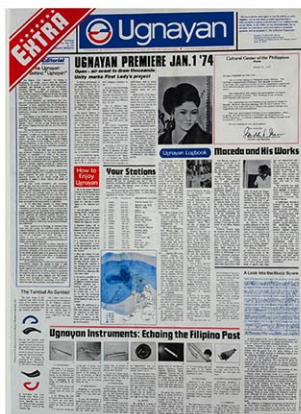
フィリピン文化センター発行印刷物の複製版 1973. Published for the Cultural Center of the Philippines (CCP) by Ugnaya Secretariat; 82nd Whitney Biennial