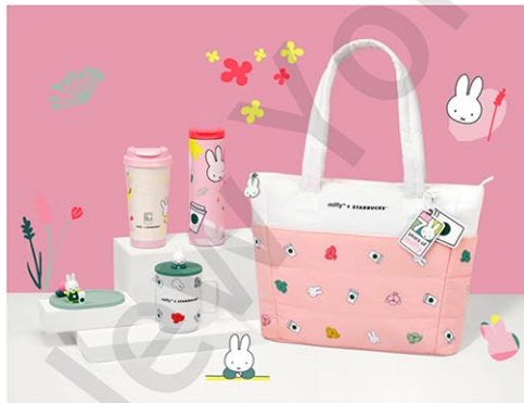
2025年秋にアジアで販売された「スタバ×ミッフィー」のコラボグッズ

スターバックス・コーヒー・カンパニー(Starbucks Coffee Company、本社:ワシントン州シアトル)は5月19日から期間限定で、人気キャラクターのミッフィーとのコラボグッズをアメリカおよびカナダ全土のスターバックスで販売する。